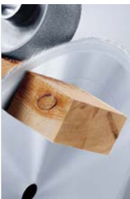
Längen- und Breitenzuschnitt