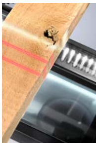
Scannen / Optimieren