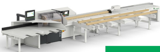
Schiebersäge OptiCut S 50+

Erleben Sie live eine Hochleistungsschiebersäge mit automatischer Roboterstapelung für eine voll automatisierte Palettenfertigung. Maschinenkonstellation: OptiCut S 90 mit Breitenzuschnittsaggregat wFlex+, Sortierung und automatischer Abstapelung.