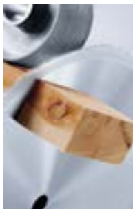
Rozkrój wzdłużny i poprzeczny