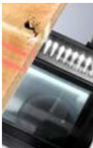
Skanowanie / optymalizacja