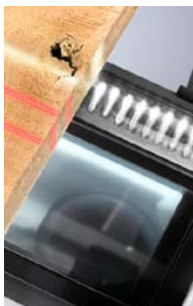
Scanner / Optimisation